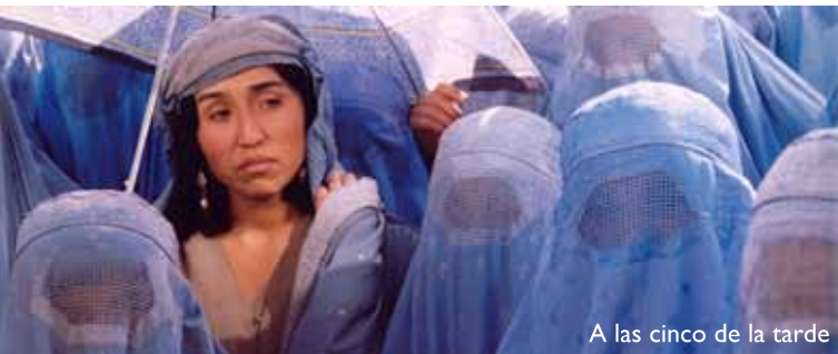
A las cinco de la tarde

Per altra banda, Buda explotó por vergüenza (Hana Makhmalbaf, 2007), explica les dificultats de la protagonista, una nena de sis anys, llesta i cultivada, que vol anar a l'escola. Allà es trobarà amb el rebuig dels infants, que emulen el rol masculí de la societat violenta i masclista en que viuen. Nens que tracten a les nenes de manera cruel: un dels jocs és fer veure que la lapiden, utilitzant pedres de veritat, o les tanquen en una cova per deliberar sobre els seus drets i el seu destí, com a una propietat més de l'home. En la mateixa línia