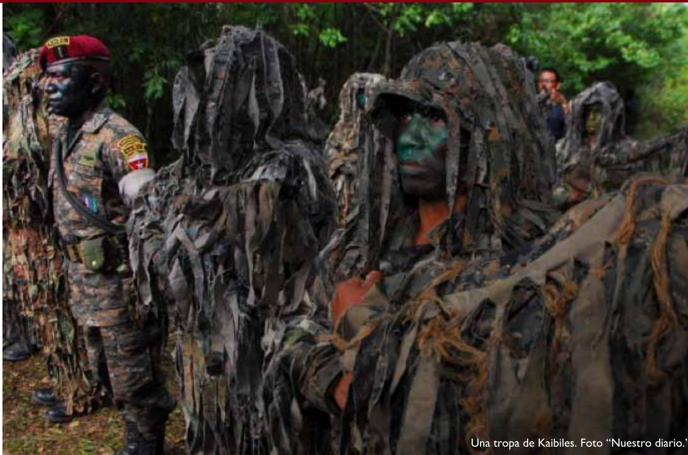
Una tropa de Kaibiles.

combate. En los pa3ses de Alemania, Austria, Reino Unido, Estados Unidos los han apodado como " Terribles Maquinas de Matar ", son entrenados en condiciones extremas y de sobrevivencia. En sus entrenamientos ponen a prueba teor3as y lemas como: " La mente domina al cuerpo ", " Si avanzo, s3gueme; si me detengo, apr3miame; si retrocedo Mátame ", " procede como Dios, que nunca llora o como Lucifer que nunca reza ". Ellos deben estar preparados para ejecutar ataques de aniquilamiento, penetraciones en territorios enemigos.