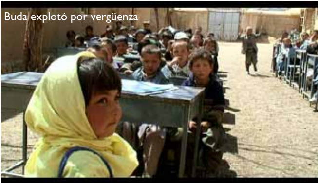
Buda explotó por vergüenza

Per altra banda, Buda explotó por vergüenza (Hana Makhmalbaf, 2007), explica les dificultats de la protagonista, una nena de sis anys, llesta i cultivada, que vol anar a l'escola. Allà es trobarà amb el rebuig dels infants, que emulen el rol masculí de la societat violenta i masclista en que viuen. Nens que tracten a les nenes de manera cruel: un dels jocs és fer veure que la lapiden, utilitzant pedres de veritat, o les tanquen en una cova per deliberar sobre els seus drets i el seu destí, com a una propietat més de l'home. En la mateixa línia